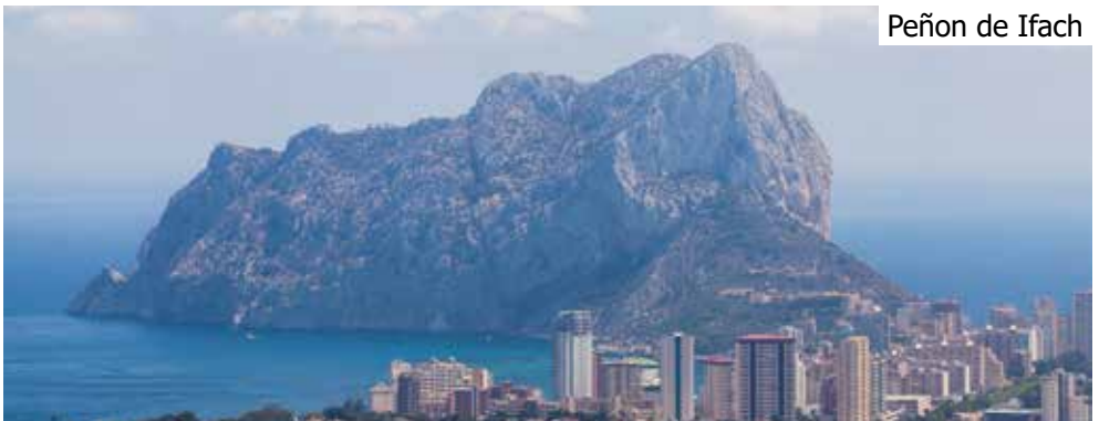
Peñon de Ifach